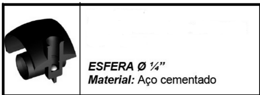
Corte representativo detalhe rolamento esfera (aço cementado 1/4")