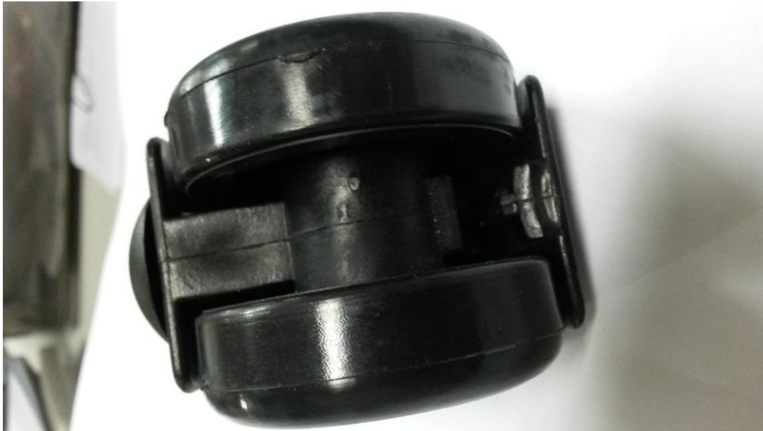
Detalhe blindagem – Vista inferior