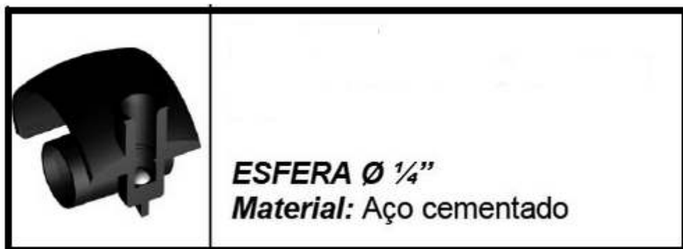
Corte representativo detalhe rolamento esfera (aço cementado 1/4")