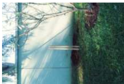
20180522_095040_Film3.jpg 2 MB