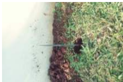
20180522_095122_Film3.jpg 2 MB

Enviadas: Quinta-feira, 24 de maio de 2018 11:36:07