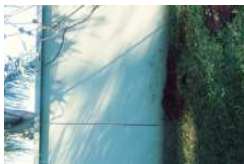
20180522_095017_Film3.jpg 2 MB