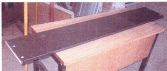
SAIA 18 MM 25CM X 155 CM - COR PRETO

Padrão do melamínico: cor preto fosco. Padrão do bordas : bordas cor preto fosco.