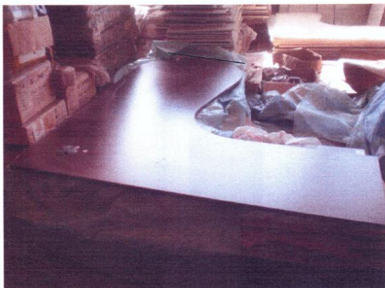
TAMPO 25MM ESTAÇÃO C / PENÍNSULA 213 CM X183 CM - COR WENGUE