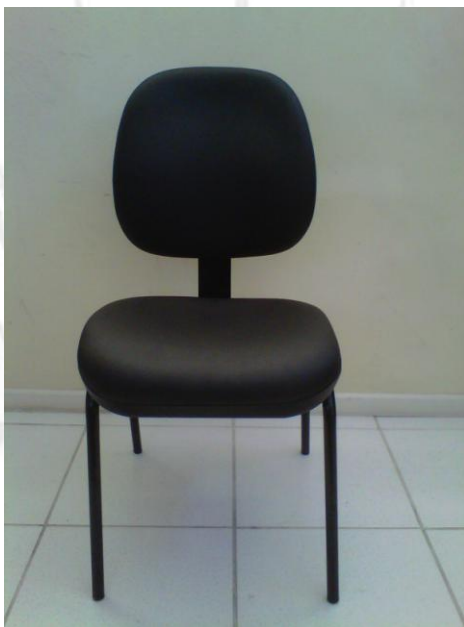
Foto referencial Cadeira

Apor placa de identificação metalizada auto-adesiva, sob o assento da cadeira, contendo o nome do fabricante e o prazo de garantia do produto (garantia até mês/ano).