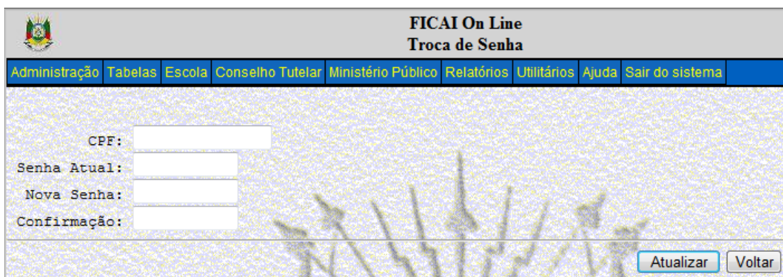
Figura 3 - Troca de senha.