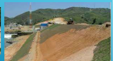
Barragem de terra