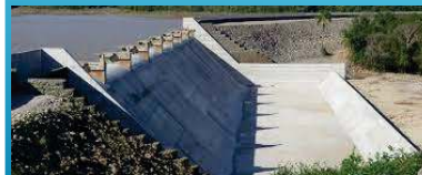
Barragem de concreto